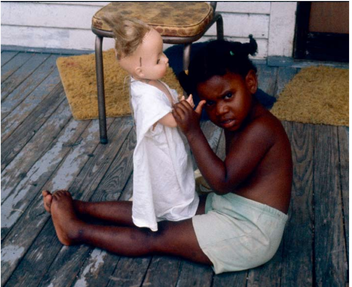
Pige med hvid dukke, Detroit, MI, 1972