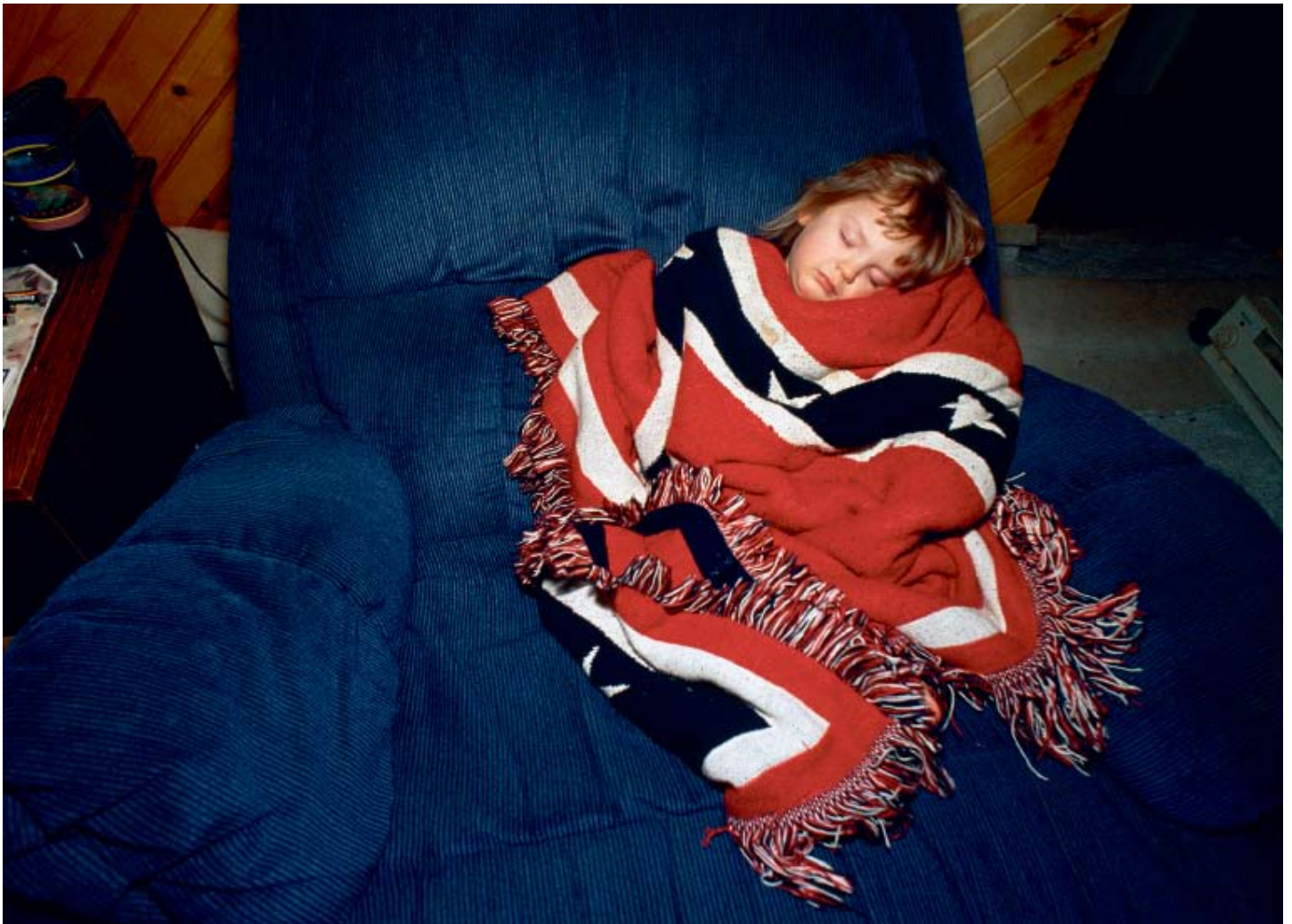
Svøbt med kærlighed i hadets tomme symbol, Butler, IN, 2002

Hvad er mere uskyldigt end et sovende barn? Hvordan virker det på os, når vi opdager, at tæppet, som skal holde barnet varmt, er et sydstatsflag? Et flag, der er blevet et vigtigt symbol på had mod de sorte, især af Ku Klux Klan.